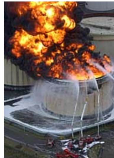
図1 十勝沖地震で石油タンク炎上

この長周期地震動に関しては、コンビナートの石油タンクや超高層ビル、さらには超大橋などの巨大構造物だけを襲う。巨大構造物を破壊するほどのエネルギーを秘めた地震動である。いままで、石油タンクを除いて、巨大構造物に大きな影響を及ぼすようなこの長周期地震動を経験したこ